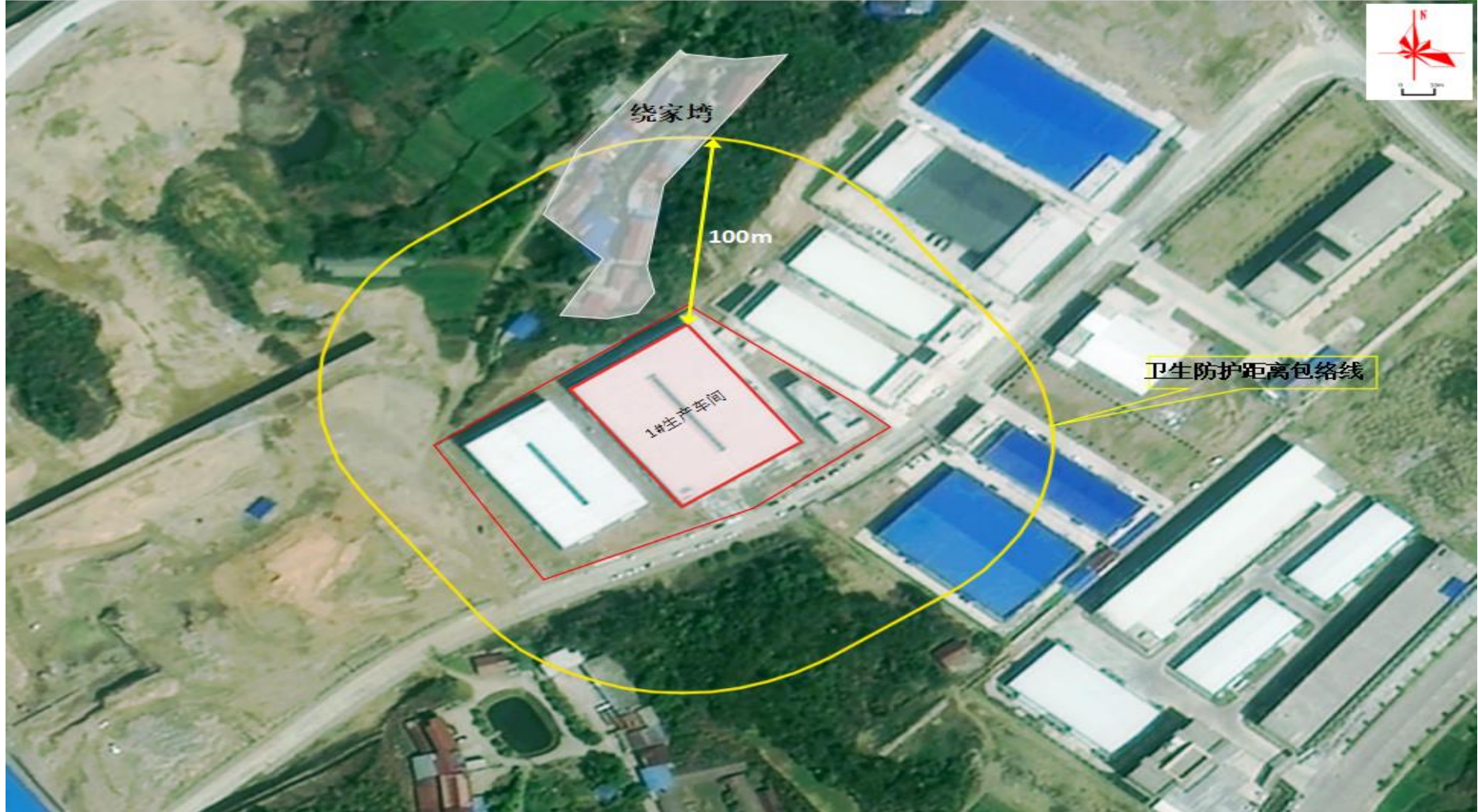
附图5 项目卫生防护距离包络线图