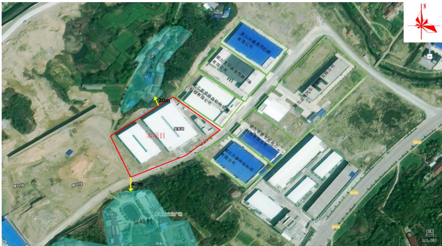
附图2 项目周边环境关系示意图