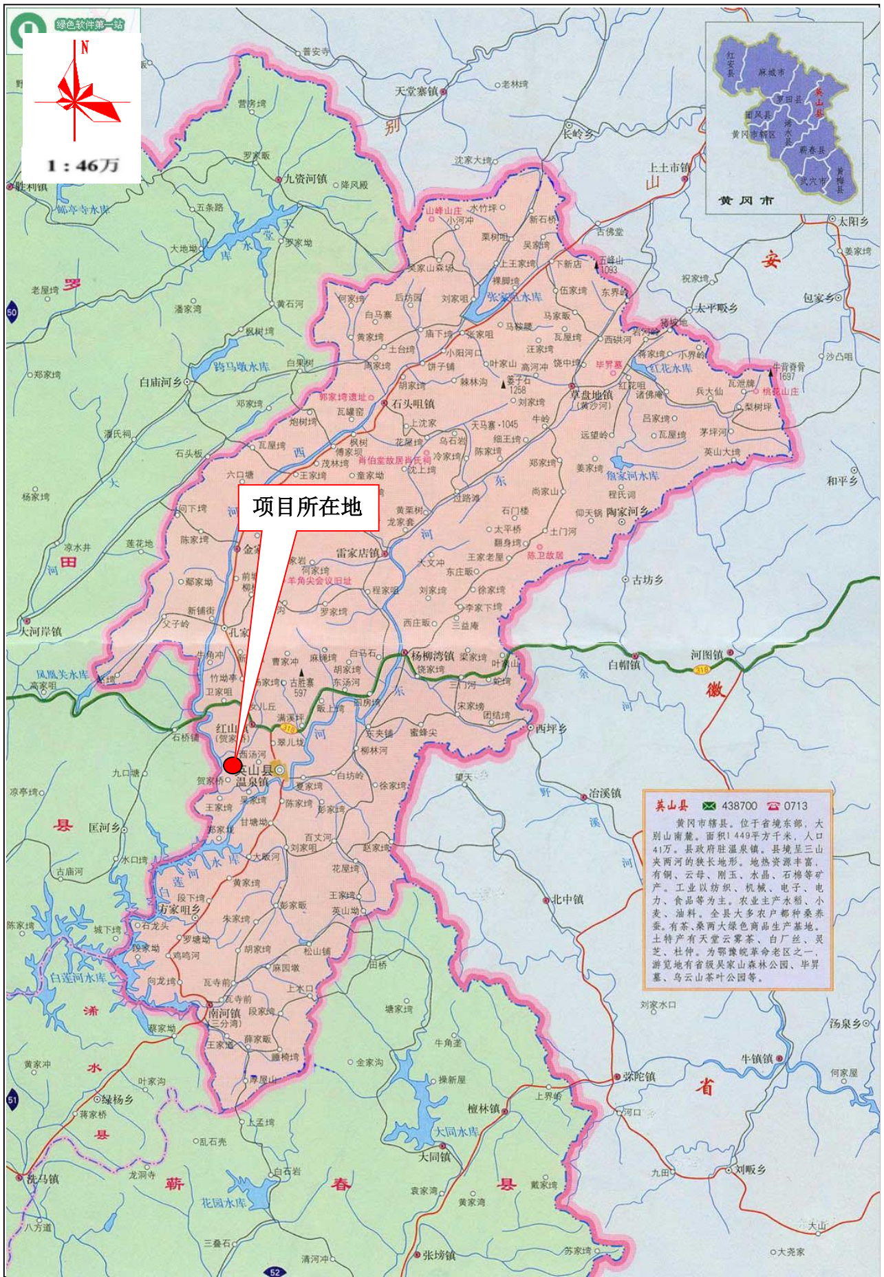
附图1 项目地理位置示意图