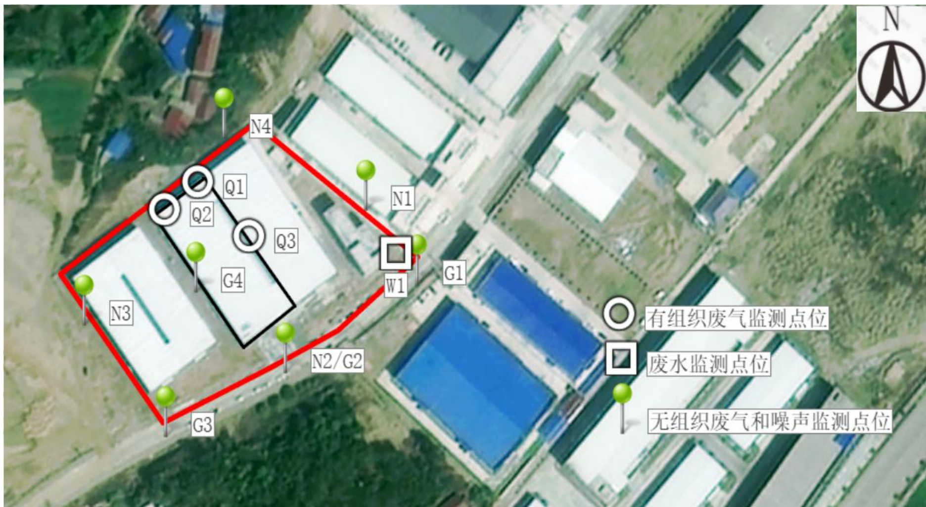
附图 4 项目验收监测点位示意图